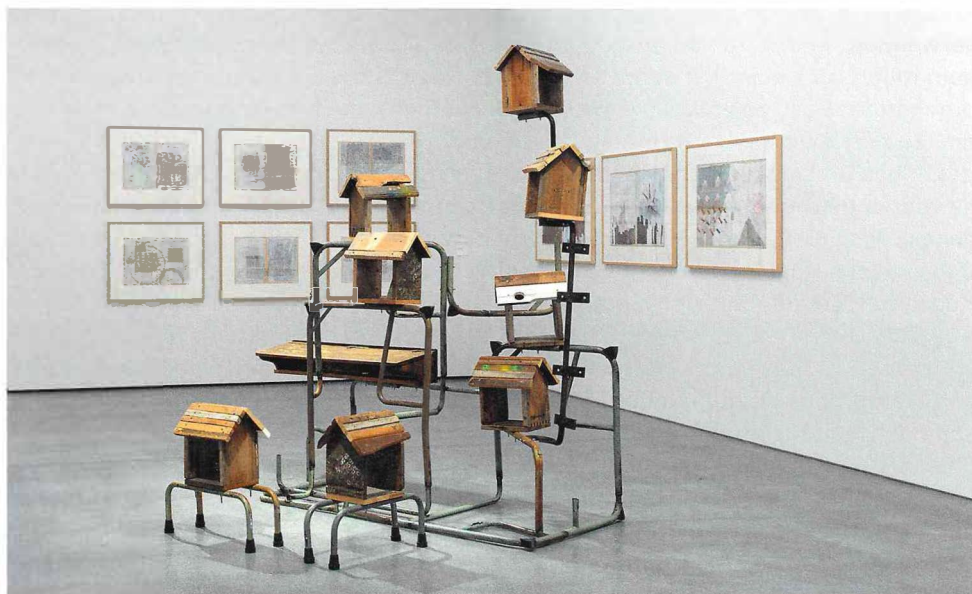
Kemang Wa Lehulere, «My Apologies to Time II», 2017, ausrangierte Schulbänke, Stahl, Sprühfarbe, 2,3 x 2,1 x 1,4 m; Zeichnungen von Erica Pedretti, Ausstellungsansicht Bündner Kunstmuseum Chur